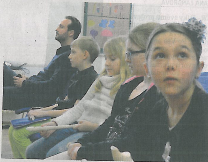
Soutěžící ve hře na zobcové flétny čekající na své vystoupení a sledující jiné žáky.

Zdeněk Patrovský, zástupce ředitele ZUŠ Louny